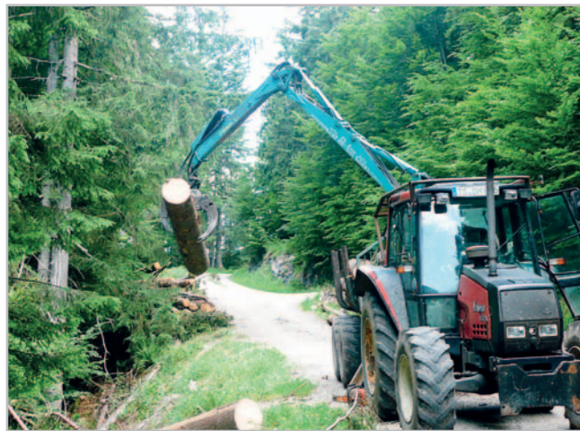
Už nyní se projevuje v lesnictví trend nedostatku manuálně pracujících dělníků a kvalitních těžařů, kteří odcházejí do země, kde platí víc

odměňování, jak je vidět z grafu 2, jsou zaměstnanci či najímání živnostníci placeni v průměru ještě hůře. To zřejmě odpovídá faktu, že ať vlastníci lesů se svými zaměstnanci, či živnostníci jsou schopni minimalizovat své náklady a zefektivnit lesní práce. Proto jsou tyto pracovníci schopni akceptovat nižší odměňování své práce, protože v porovnání např. s lesními dělníky vykonávajícími práce pro smluvní partnery LČR mají v konečném součtu vyšší platy. Proto ti pracovníci, co v lesnictví zůstali pracovat, a to hlavně pro smluvní partnery LČR, lze nazvat doslova posledními mohykány, kterým nelze než poděkovat za jejich úsilí. Bez nich by byla situace v lesích ještě