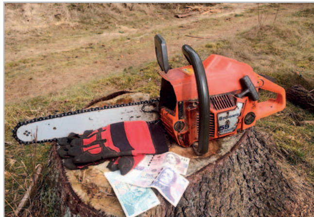
Pokud nemá lesnictví zabřednout v hluboké personální krizi, musí nastat změna v odměňování manuálních pracovníků i hajných

lesů, jako jsou například Lesy České republiky, s. p. (LČR), Vojenské lesy a statky ČR, s. p., (VLS) nebo lesy ve vlastnictví církvi. Odměňování v těchto podnicích navíc nepřímou ovlivňuje příjmy i u subdodavatelů prací, živnostníků a zaměstnanců v těžební i péstební činnosti v soukromé sféře. Tito subdodavatelé mají vůči velkým státním podnikům lesů horší vyjednávací pozici a nepomáhá ani role českých odborových organizací v tomto sektoru. Státní lesy totiž dominují na území ČR v rámci správy lesního fondu (57 % lesů